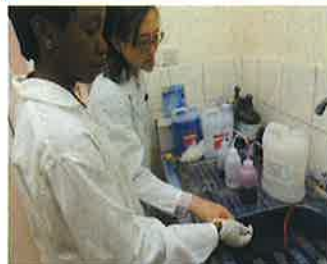
医療技術者に対する 技術指導の様子

国内でつみかさねてきた技術・知識・経験を活かして世界の人々を結核から守るため国際協力に取り組んでいます。