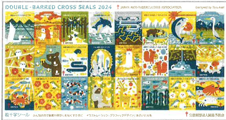
大型シール(24面)募金目安 1,000円

日本には花鳥風月という美しい風景を表す言葉があります。「自然と調和」をテーマに生命を持つものたちがともに生きる姿をシールにしました。これからもずっと守っていききたい日本の美しい自然が描かれています。