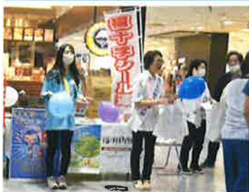
青森県結核予防婦人会 による啓発キャンペーン