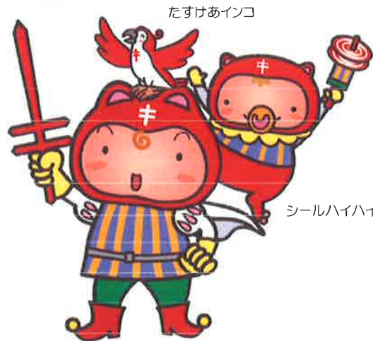
シールぼうや 複十字シール運動イメージキャラクター