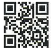
募金申込みフォーム。